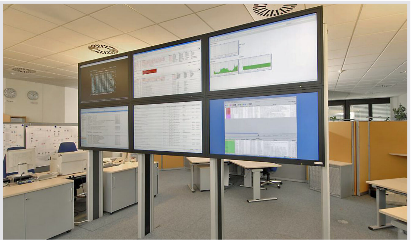
Großbildsystem für Arvato AG von JST

Als Tochter der Arvato AG ist Arvato Systems Teil des weltweit agierenden Medienunternehmens Bertelsmann.