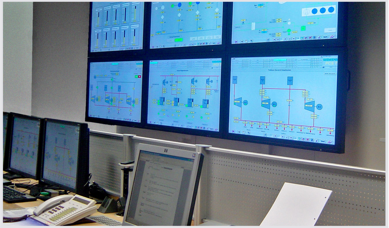
Brauerei Beck, Bremen - Leitwarte von JST

In der Leitwarte bei InBev werden alle Messergebnisse für die Produktion überwacht und Prozesse gesteuert.