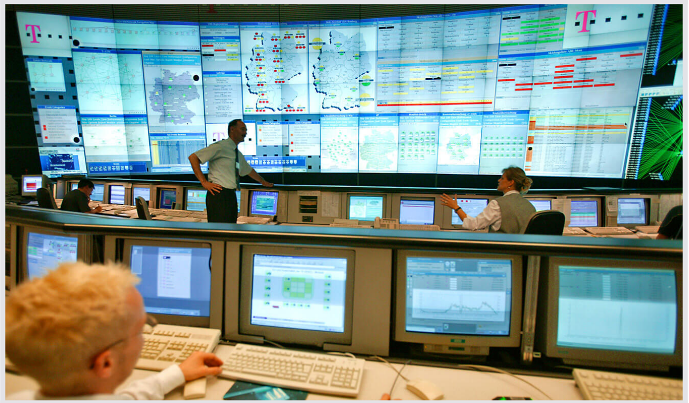
Deutsche Telekom Bamberg - Network-Management-Center von JST

Das Network-Management-Center (NMC) ist einem kompletten „Facelift“ unterzogen worden. Die gesamte Planung , Projektierung und Ausführung des NMC's wurde von Jungmann-Systemtechnik übernommen.