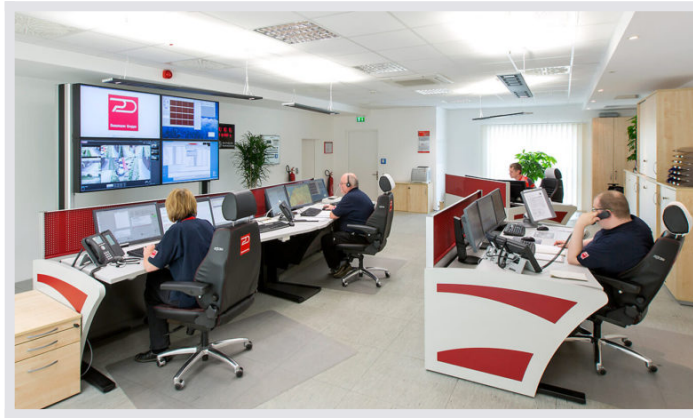
JST Großbildwand: Blick hinter die neu installierte Display-Wall JST Überwachung: Mehr als 2000 Kunden werden von Gardelegen aus betreut

Mehr als 2000 Kunden werden von Gardelegen aus betreut. „Dussmann Service“ bietet über 70 Einzeldienstleistungen aus einer Hand: Technisches Management, Catering, Sicherheits- und Empfangsdienste, Gebäudereinigung, Kaufmännisches Management und Energiemanagement. Darüber hinaus zählt das integrierte Gebäudemanagement zum Angebot, das alle Dienstleistungen rund um das Gebäude intelligent und optimal bündelt und organisiert.