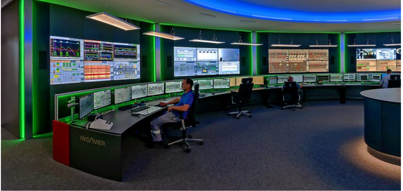
Virtuelle 360°-Tour durch die Leitwarte.

Auch die Mitarbeiter bewerten die INGAVER-Leitwarte als durchweg positiv. Sie wurden bereits in einer frühen Projektphase an den Planungen beteiligt. Möglich durch virtuelle Rundgänge dank fotorealistischer 3D-Planungen , angefertigt von den JST-Spezialisten.