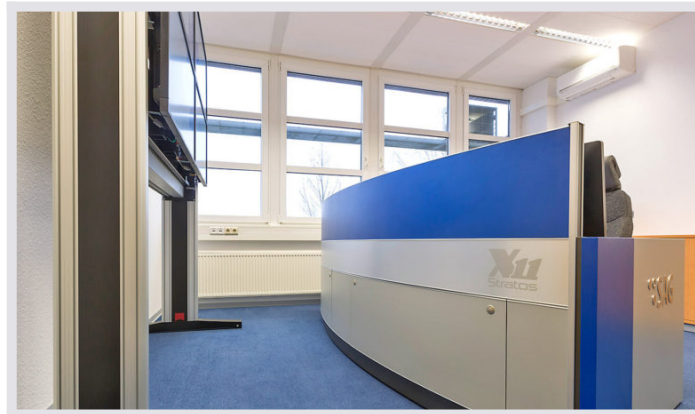
JST Leitstandische: Der Stratos X11® OperatorDesk – hier in der Ausführung „Curve“ – erfüllt ergonomisch wie optisch höchste Ansprüche.