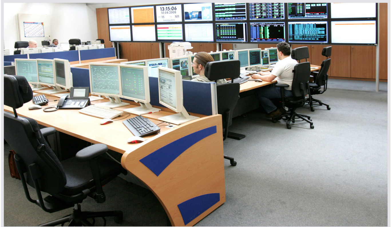
VW Wolfsburg. Enterprise Command Center.

Im Enterprise Command Center (ECC) werden im 7/24-Stunden Betrieb Mainframe, Server und Netze überwacht und gesteuert. JST hat die Raumplanung und die Lieferung der Spezialmöbel für das IT-Kontrollzentrum durchgeführt.